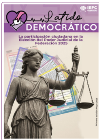
Revista Digital Latido Democrático

La participación ciudadana en la Elección del Poder Judicial de la Federación 2025