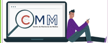
Centro de Monitoreo de Medios

En esta sección encontrarás la información sobre los convenios suscritos por el IEPC Guerrero y otras instituciones